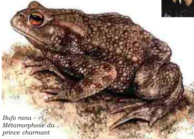
Bufo rana - Métamorphose du prince charmant

J'ai eu la chance de soigner, d'aider un petit garçon qui est né à l'hôpital Erasme, le 11 septembre 2001 et qui a séjourné au service néonatal du 11 septembre au 08 décembre 2001.